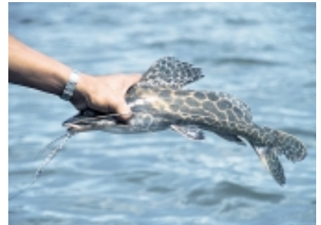
Figur 5 En giftig malle, Pimelodus maculatus , tatt med krok i Essequibo-elven, Guyana.