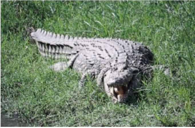
Figur 8 Stol aldri på en trekvart tonns nilkrokodille som smiler.