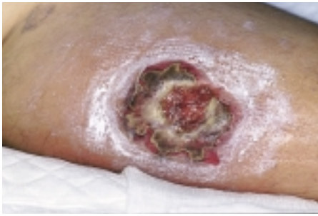
Figur 3 Lesjon på leggen etter sannsynlig Loxosceles -bitt i Brasil. Pasienten hadde sittet med kortbukser på en tømmerstabel.