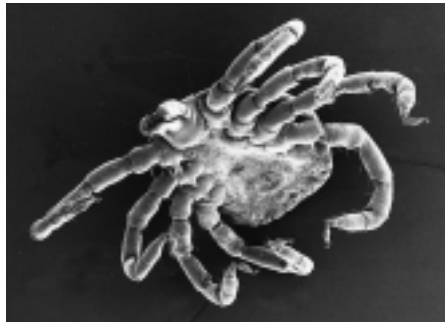
Figur 4 Elektronmikroskopibilde av Amblyomma-species , nymfe, fra et ekspedisjonsmedlem i regnskogen i Guyana.

lig lokal cytotoxisk effekt, som kan gi svære nekroser (fig 3).