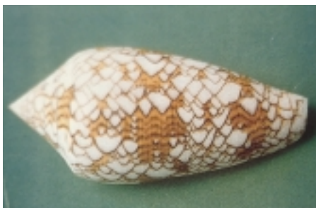
Figur 2 Conus textile , disse vakre og livsfarlige sneglene, kan man få lyst til å ta opp når man snorkler (fra Gopalakrishnakone (3))

nakensnegler adopterer nesleceller fra nesledyr de har spist, og neslecellene transporteres da til sneglenes overflate.