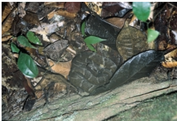
Figur 7 Bothrops athrox . Dette eksemplaret stod vi like ved i regnskogen i Guyana da vår indianerguide gjorde oss oppmerksom på forholdet.