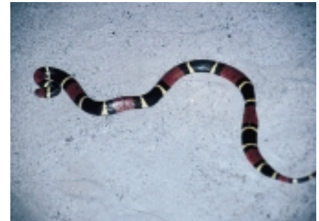
Figur 6 Korallslange, Micrurus surinamensis , fra Iwokrama feltstasjon, Guyana.

giftbrodd i bakenden, og en del maur har også giftig bitt. Ett enkelt stikk er ikke farlig om man ikke har anafylaksi. Siden afrikanske honningbier ble introdusert til Brasil i 1956 har de blandet seg med de stedegne honningbiene, og de har siden 1990 spredt seg i USA. Disse biene har tendens til å angripe i flokk, og dødelig dose er ca. 500 stikk for en voksen person. Man regner nå med ca. 60 dødsfall hvert år på grunn av «killer bees» i USA (2).