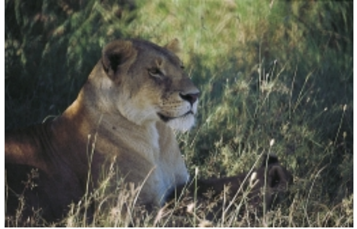
Figur 9 Løvinne.

lindres ved at området holdes nede i vann som er så varmt som pasienten kan tåle, på grensen til det som gir brannskader, ca. 45 °C (2). Prosedyren må gjerne gjentas flere ganger. Piggskater kan skade mennesker om de blir fisket. Stikk av fiskepigget er sjelden dødelig.